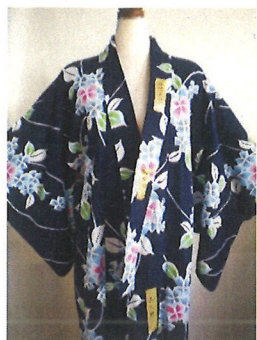
1級和服「浴衣」の見本