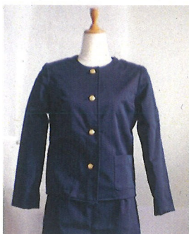
1級洋服「ジャケット」の見本